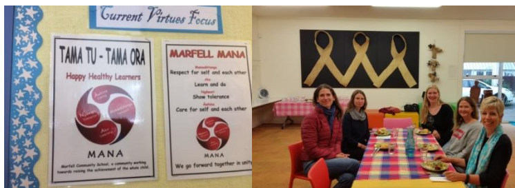
links: die aktuellen Prinzipien der Marfell Community School

Das Wochenende bot einen angenehmen Kontrast zur kommenden Woche, die geprägt war von den Besuchen mehrerer Einrichtungen, bis zu fünf am Tag. Exemplarisch möchte ich den Besuch der Marfell Community School herausstellen, der überaus beeindruckend verlief. Auf die Marfell gehen viele Kinder aus den armen bzw. ärmsten Verhältnissen. Die Schule hat über Spenden organisiert, dass alle Kinder täglich Frühstück und einen kleinen Mittagssnack bekommen. Eine Lehrerin erzählte uns, dass die Kinder sehr dankbar für die Spenden und sehr motiviert zum Lernen sind. Ihren Beruf beschreibt sie als very rewarding .