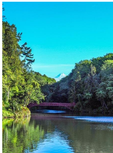
Gemeinsamer Ausflug, Mount Taranaki

Das Wochenende bot einen angenehmen Kontrast zur kommenden Woche, die geprägt war von den Besuchen mehrerer Einrichtungen, bis zu fünf am Tag. Exemplarisch möchte ich den Besuch der Marfell Community School herausstellen, der überaus beeindruckend verlief. Auf die Marfell gehen viele Kinder aus den armen bzw. ärmsten Verhältnissen. Die Schule hat über Spenden organisiert, dass alle Kinder täglich Frühstück und einen kleinen Mittagssnack bekommen. Eine Lehrerin erzählte uns, dass die Kinder sehr dankbar für die Spenden und sehr motiviert zum Lernen sind. Ihren Beruf beschreibt sie als very rewarding .