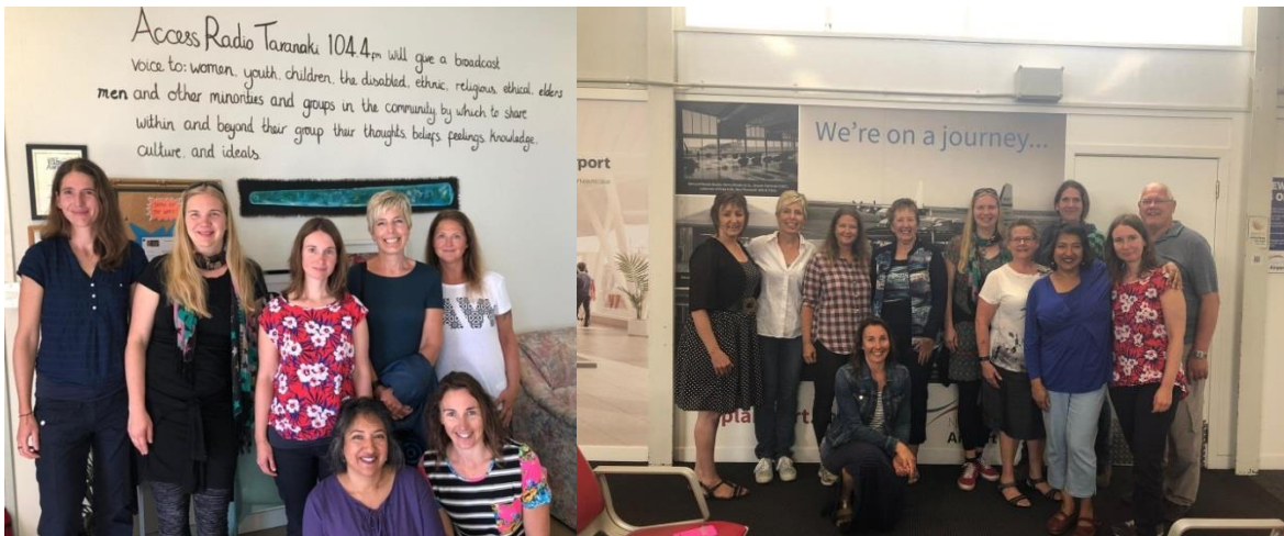
links: girls talk bei Radio Taranaki auf fm 104,4

Die Arbeitswoche endete mit einem Radiointerview bei einem kleinen lokalen Sender. Freitags vormittags gibt es dort einen girls talk und da unsere Gruppe nur aus Frauen bestand, wurden wir zum Interview eingeladen und über unsere Arbeit und das CIF-Programm befragt. Am Samstag, zehn Tage nach Ankunft in New Plymouth, ging es zurück nach Auckland. Unseren Gastfamilien aus New Plymouth brachten uns zum Flughafen verabschieden uns herzlich.